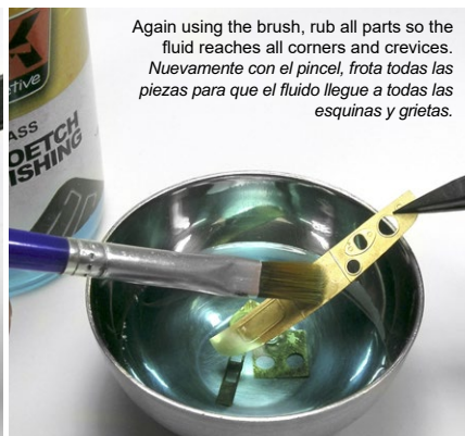
Again using the brush, rub all parts so the fluid reaches all corners and crevices. Nuevamente con el pincel, frota todas las piezas para que el fluido llegue a todas las esquinas y grietas.