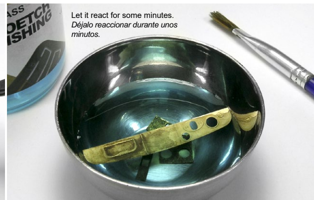
Let it react for some minutes. Déjalo reaccionar durante unos minutos.