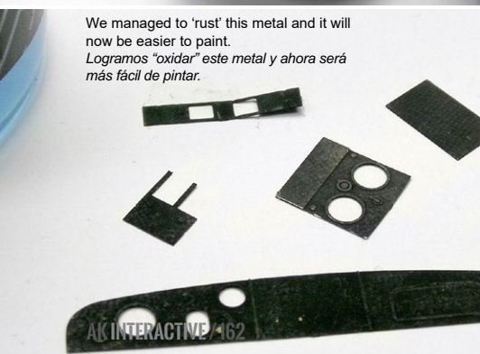
We managed to 'rust' this metal and it will now be easier to paint. Logramos "oxidar" este metal y ahora será más fácil de pintar.