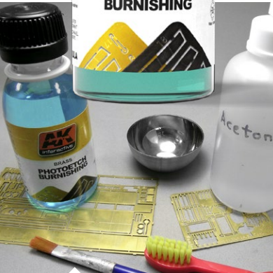
Materials needed for the process. Materiales necesarios para el proceso.

tanque. El resultado final sobre piezas de latón es un acabado muy similar al acero. Se recomienda oscurecerlas partes de fotografado antes de usar para una correcta adherencia de la pintura ya que eliminamos el barniz del fotografado.