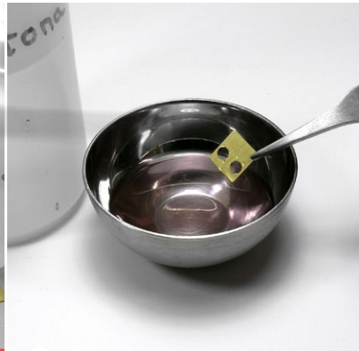
After preparing and separating all the parts with the help of tweezers, dip them into acetone. Después de preparar y separar todas las piezas con la ayuda de pinzas, sumérgelas en acetona.