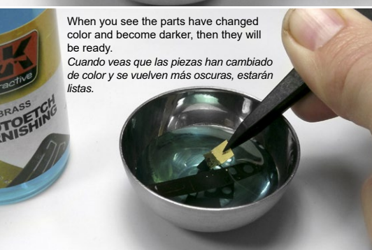
When you see the parts have changed color and become darker, then they will be ready. Cuando veas que las piezas han cambiado de color y se vuelven más oscuras, estarán listas.