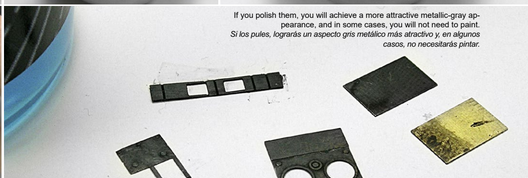
If you polish them, you will achieve a more attractive metallic-gray appearance, and in some cases, you will not need to paint. Si los pulas, lograrás un aspecto gris metálico más atractivo y, en algunos casos, no necesitarás pintar.